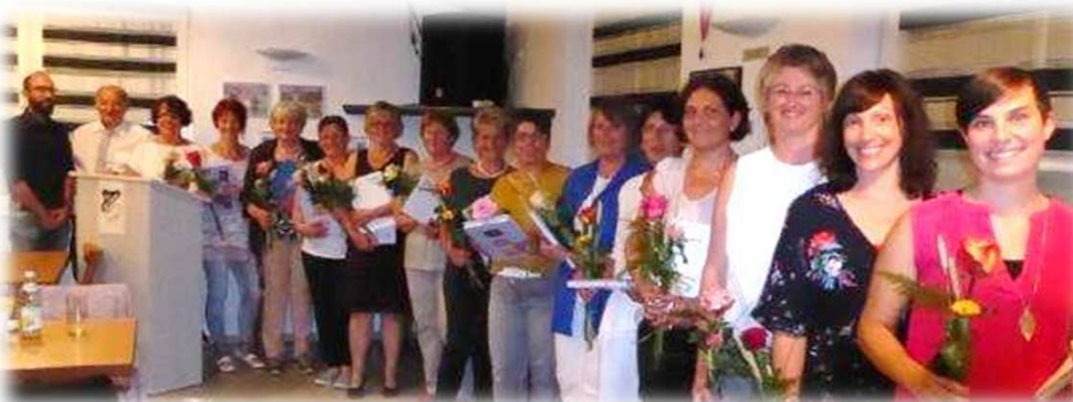
Die Geehrten ....